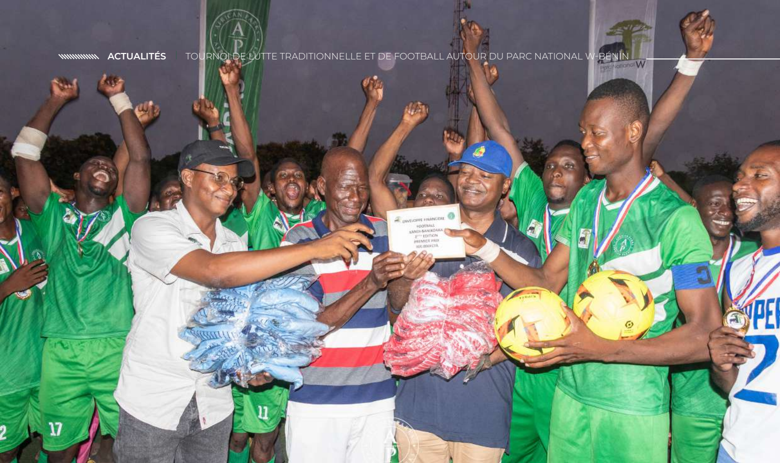
Remise de lots à l'équipe du parc du W-Bénin, vainqueur du tournoi de football, édition 2025.

la Commune de Banikoara. Victoire de Angaradebou sur un score étriqué de 1-0.