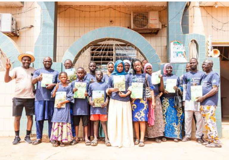
Radio SOTA FM de Malanville.

À travers ces initiatives, les jeux radiophoniques s'imposent comme un puissant outil de sensibilisation communautaire, contribuant activement à la protection durable de la biodiversité des parcs nationaux de la Pendjari et du W-Bénin.