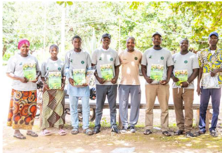
Radio Banigansé FM de Banikoara.