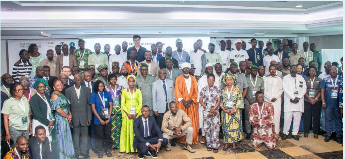
Photo de famille

L e Forum d'Information et d'Échange sur les Parcs (FIEP), édition 2025, a été couplé à la 4 ème édition du Fitness des Parcs Nationaux. L'événement s'est tenu les 12 et 13 décembre 2025 à Cotonou.