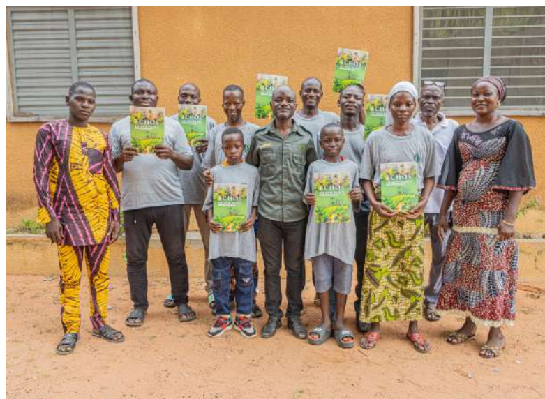
Radio Rurale locale de Tanguéta.