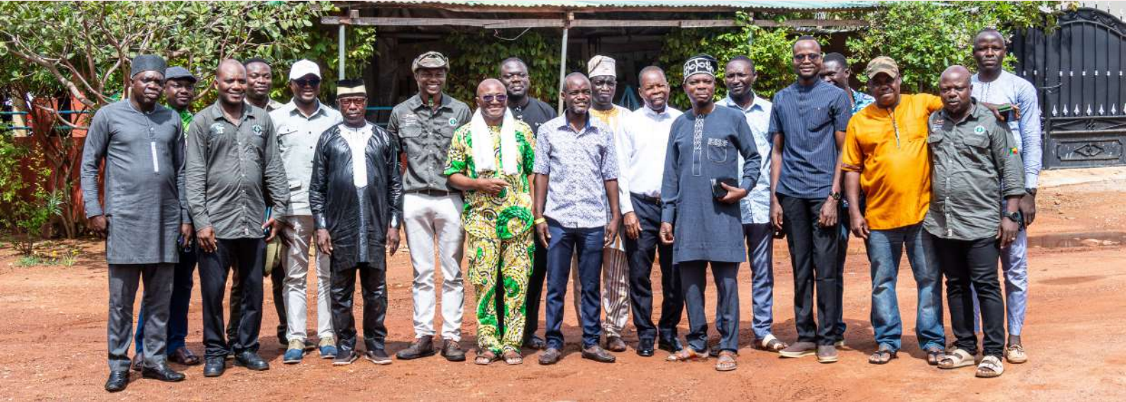
Photo d'ensemble des participants à l'atelier d'évaluation IMET du parc national de la Pendjari à Natitingou

L'évaluation IMET (Integrated Management Effectiveness Tool) est un outil participatif et standardisé, développé par l'Union européenne, visant à évaluer et à renforcer l'efficacité de la gestion des aires protégées. Réalisée tous les deux ans, cette évaluation permet d'analyser de manière globale les performances de gestion, d'identifier les forces et les faiblesses, d'améliorer la prise de décisions, la planification et le suivi des progrès, à travers une approche axée sur les résultats et l'implication active des parties prenantes locales.