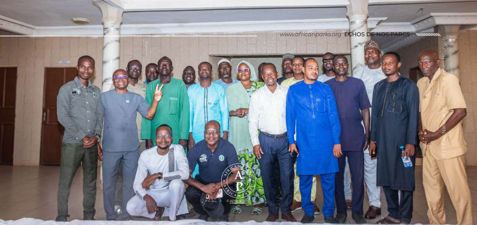
Photo d'ensemble des participants à l'atelier d'évaluation IMET du parc national W-Bénin à Parakou