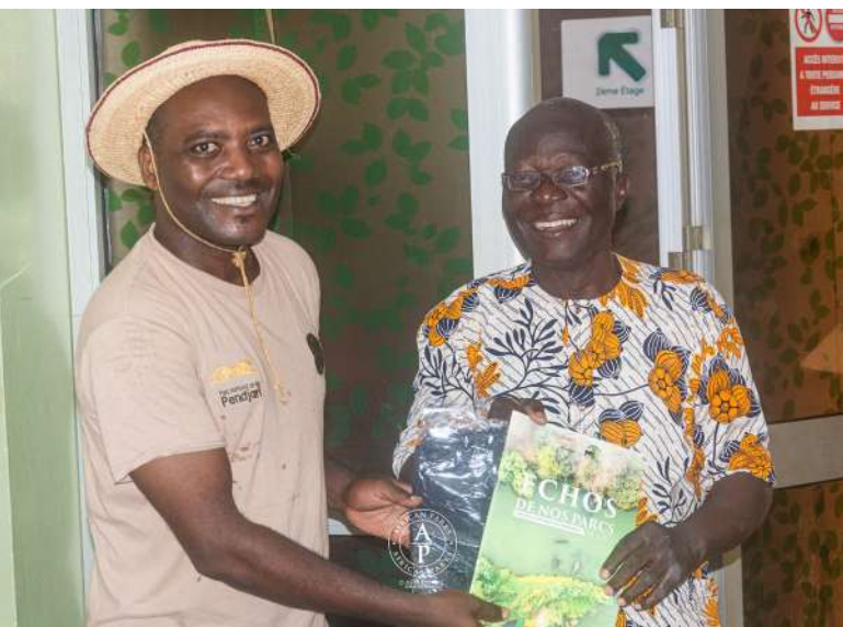
Radio SOTA FM de Malanville.