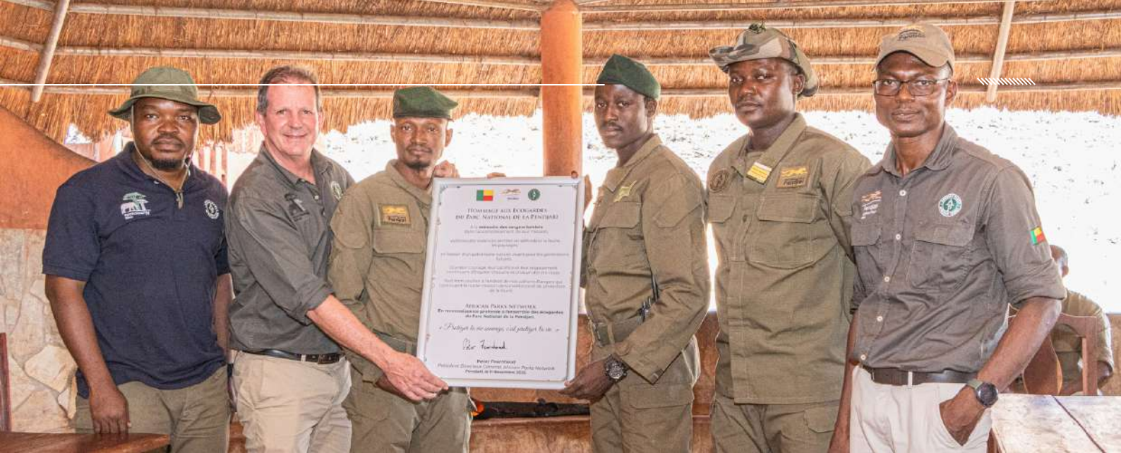
Remise du tableau d'hommage aux écocogardes du parc national de la Pendjari

nous. J'adresse tout mon soutien à nos vaillants Rangers qui poursuivent avec bravoure la noble mission de surveillance et de protection de la faune », a déclaré le PDG Monsieur Peter Fearnhead.