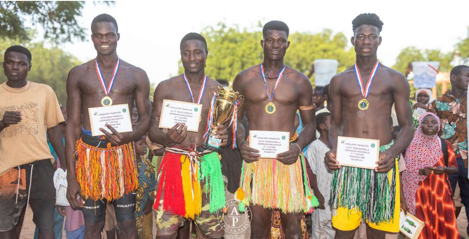
Les finalistes du tournoi de lutte traditionnelle du parc W-Bénin, édition 2025 (Malanville)

Les tournois de lutte traditionnelle et de football du Parc national du W-Bénin, ont respectivement connu leur apothéose le 17 octobre à Malanville et le 19 octobre 2025 au Stade de Kandi. Organisée par la direction du parc en collaboration avec l'ONG locale Jeunesse Santé Environnement et développement (JSED), avec le soutien du gestionnaire African Parks et ses partenaires, cette 2ème édition a mobilisé plus de dix mille spectateurs.