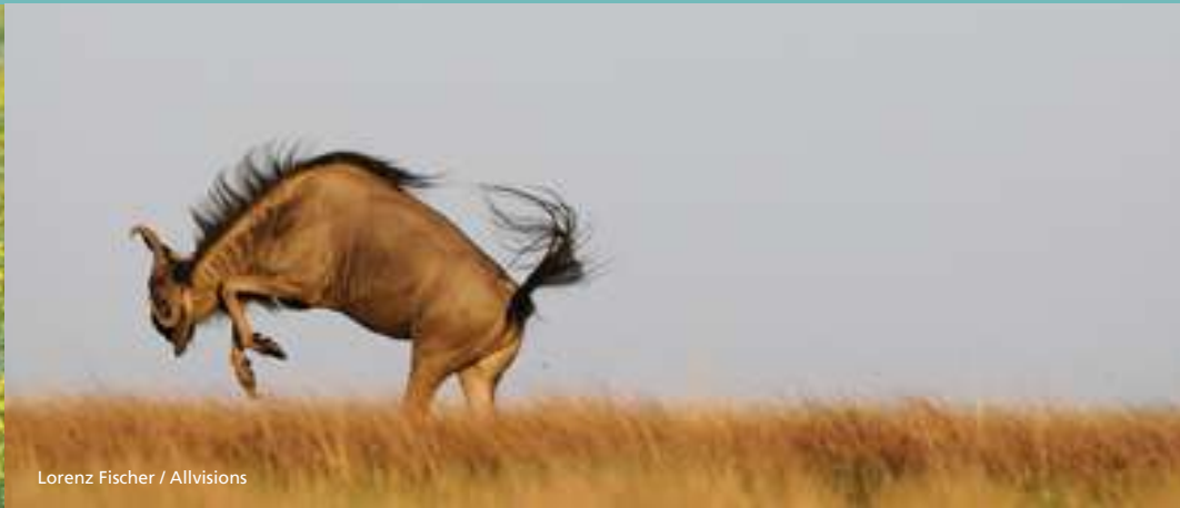
Lorenz Fischer / Allvisions