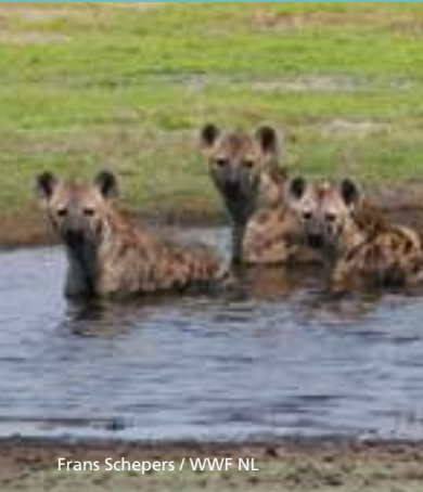
Frans Schepers / WWF NL