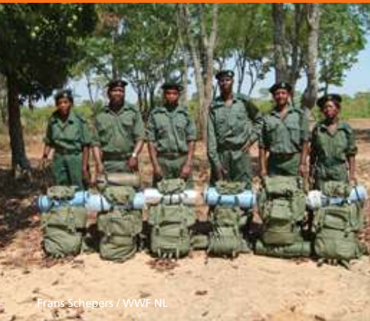
Frans Schepers / WWF NL