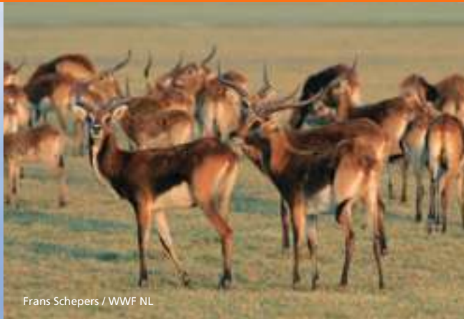
Frans Schepers / WWF NL