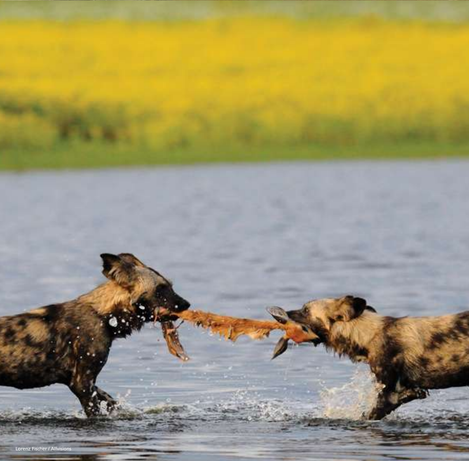
Lorenz Fischer / Allvisions