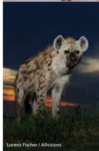
Lorenz Fischer / Allvisions