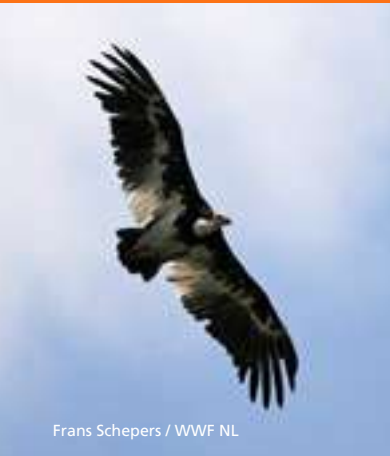
Frans Schepers / WWF NL