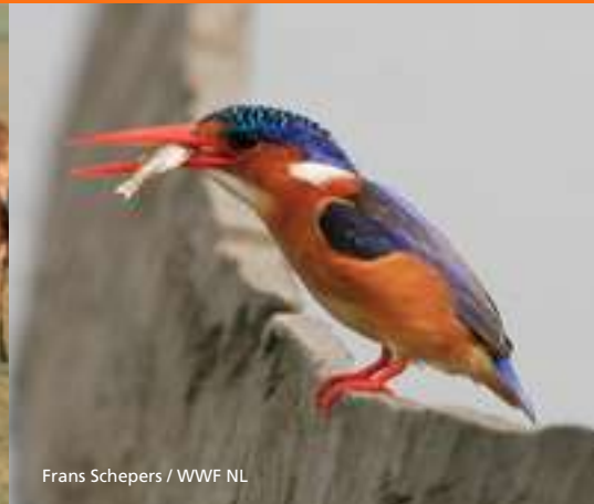
Frans Schepers / WWF NL