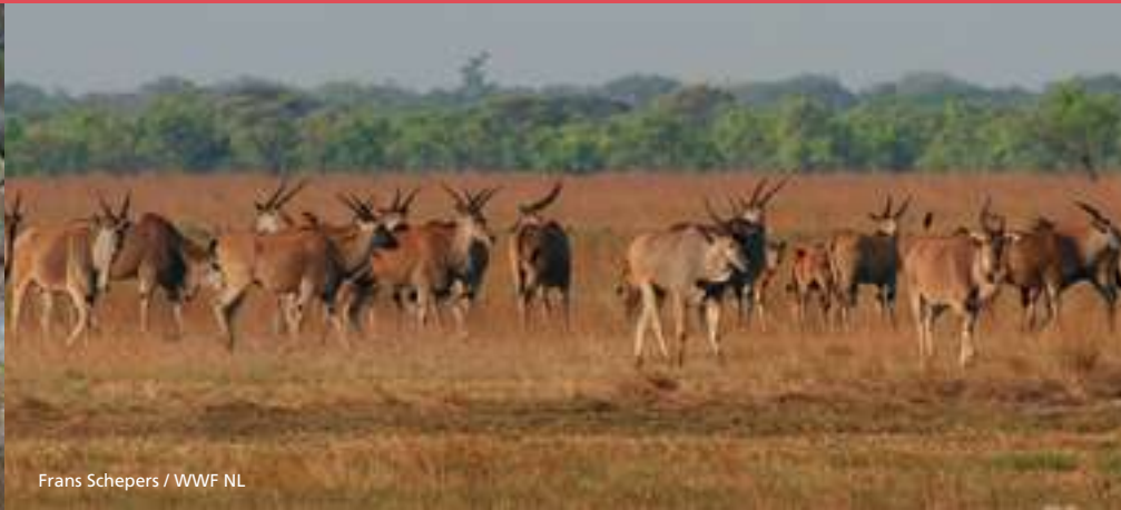
Frans Schepers / WWF NL