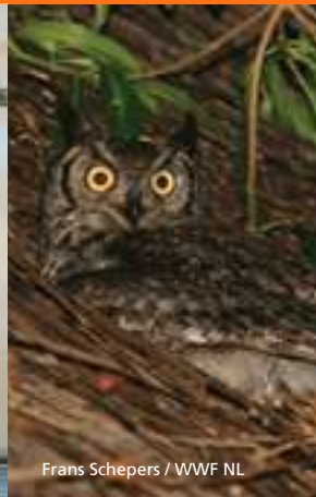
Frans Schepers / WWF NL