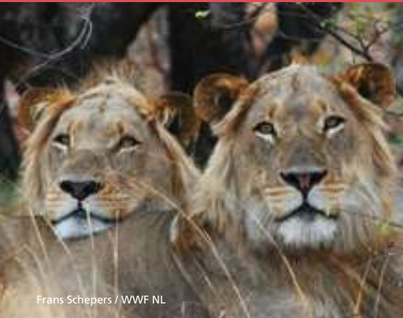
Frans Schepers / WWF NL