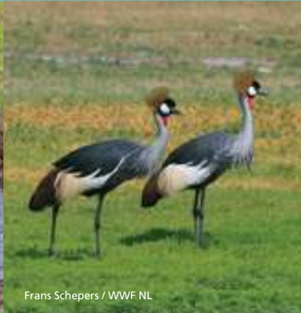
Frans Schepers / WWF NL