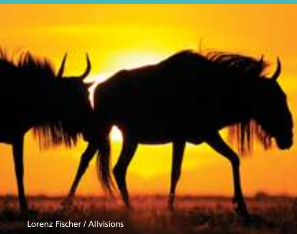
Lorenz Fischer / Allvisions