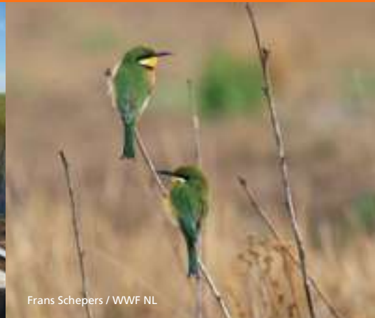
Frans Schepers / WWF NL

nouveaux CRB et le processus de création des compétences locales est en cours. Des propositions ont été recueillies, analysées, approuvées et financées pour le fonds de développement communautaire et plusieurs projets ont démarrés. Des réunions avec les parties prenantes ont été menées concernant le partage des profits, les problèmes de pêche, le partage d'informations et de la planification.