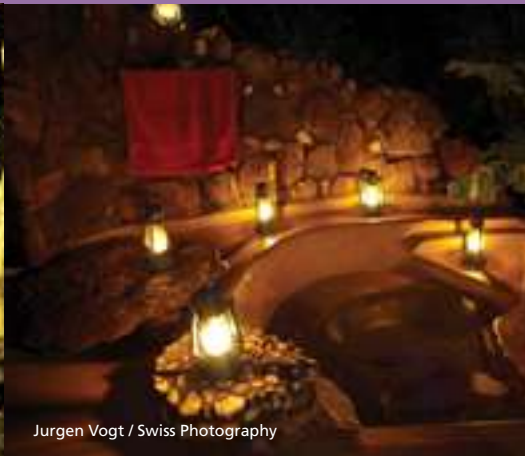
Jurgen Vogt / Swiss Photography